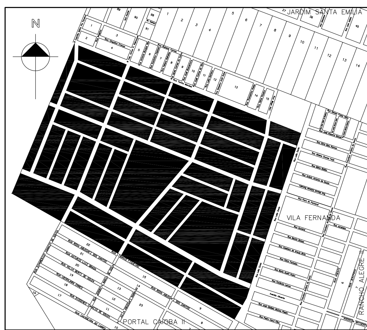
PLANTA DE SITUAÇÃO Escala 1/10.000