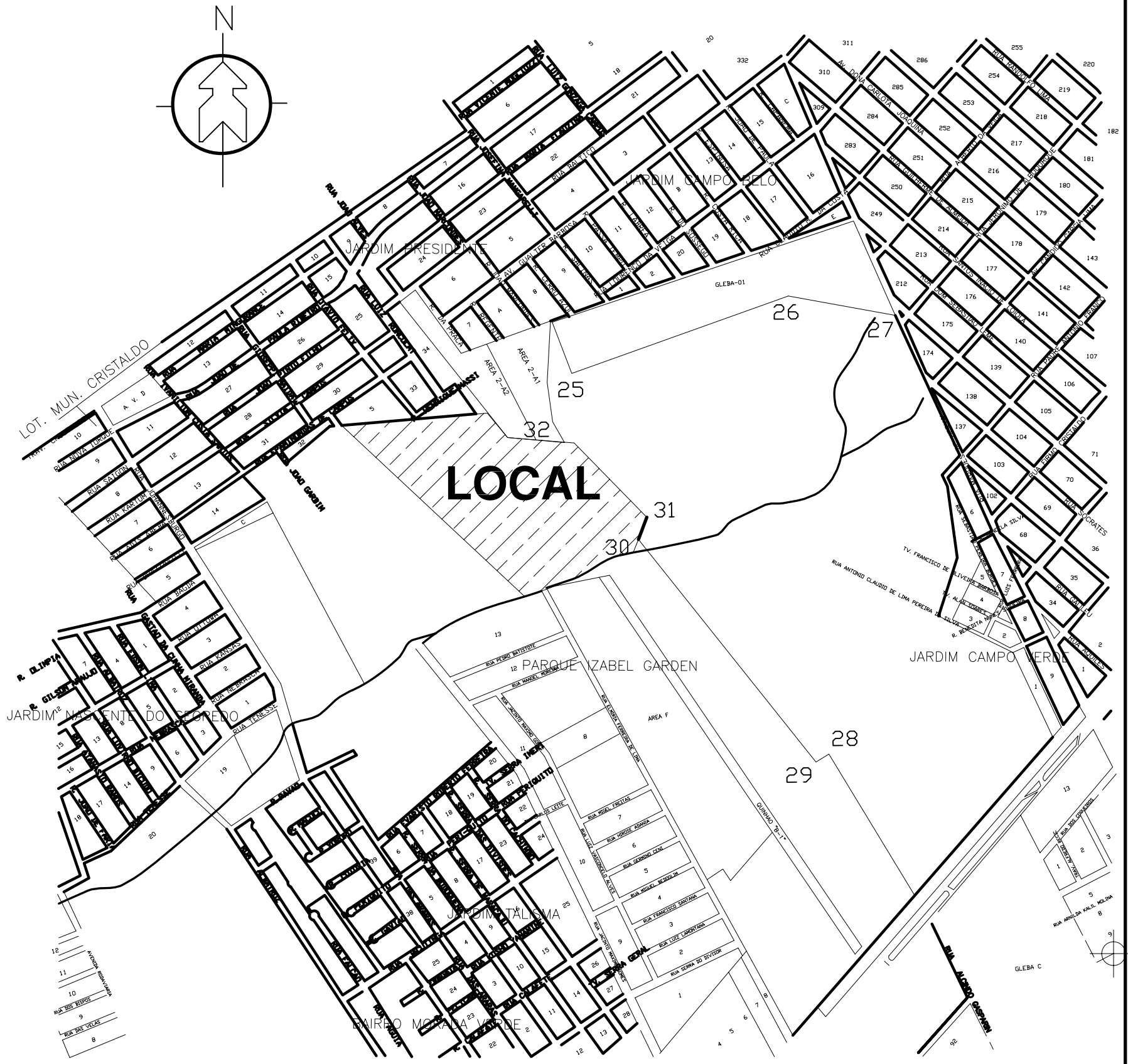
PLANTA DE SITUAÇÃO ESCALA 1:10.000