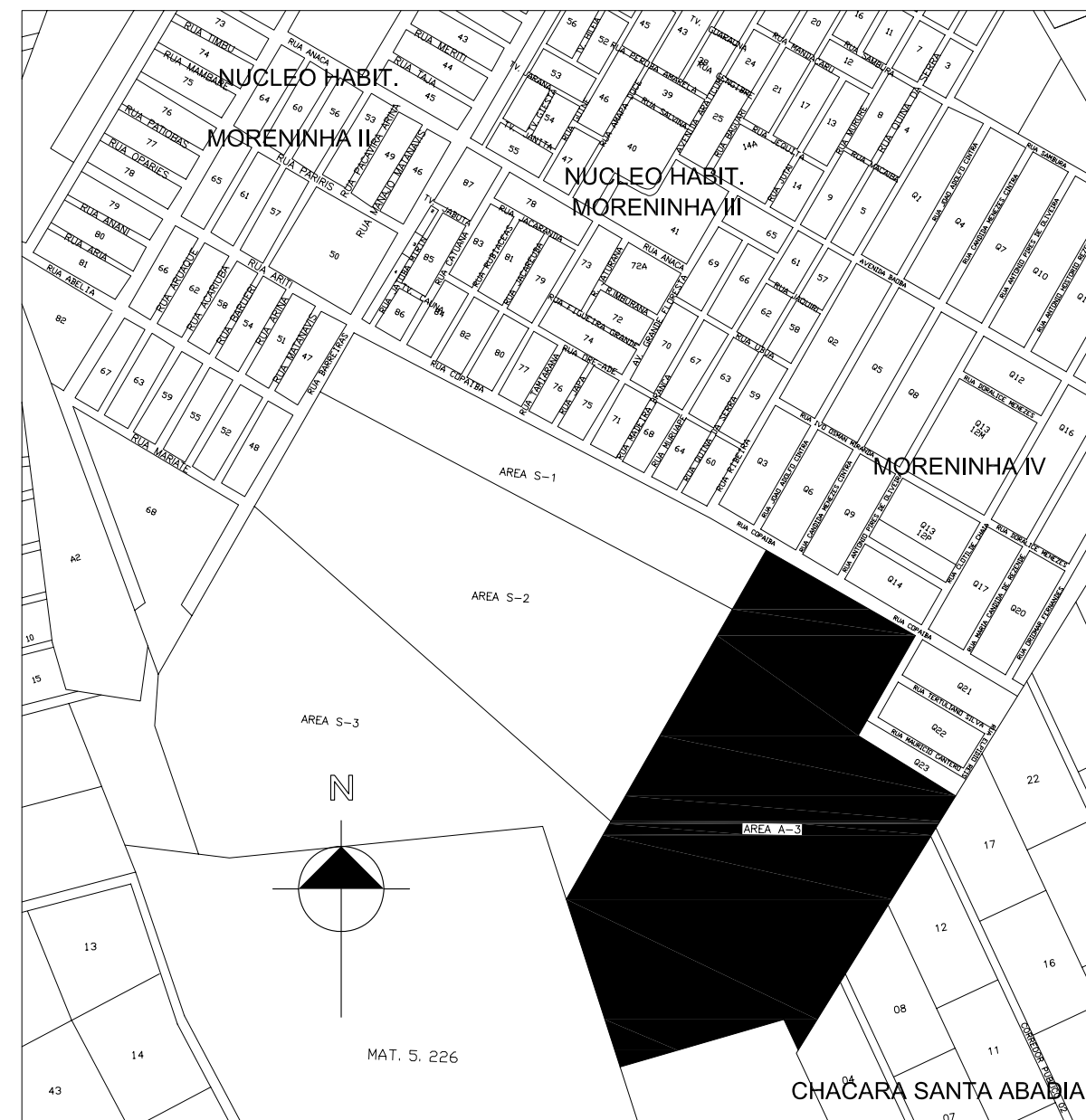
PLANTA DE SITUAÇÃO Escala 1/10.000